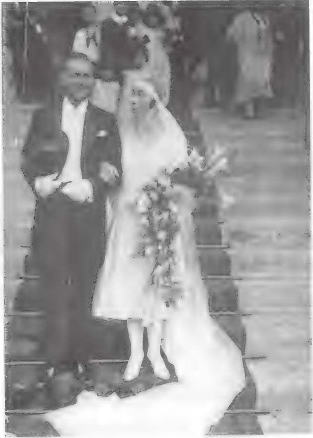
زواج لوير في كنيسة سان سولبيس في بارس ، الأول من أكتوبر ١٩٢٩